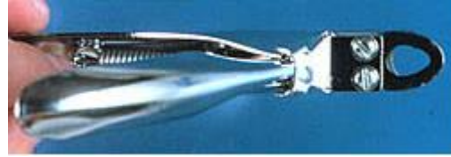
De nagel kniptang